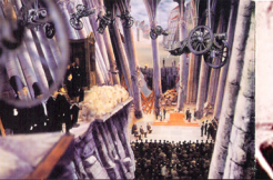
22 e 23 de Maio às 22:00 | Taxandria | um filme de Raoul Servais com concepção gráfica de François Schuiten