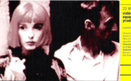
29 e 30 de Maio às 22:00 | Tykhe Moon | um filme de Enki Bilal